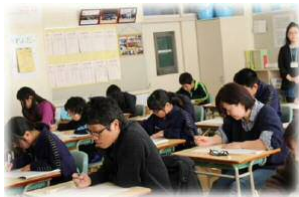
小中合同 漢字検定